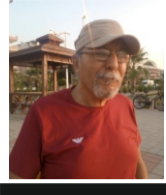
SABAHATTİN ALİ VE HALDUN TANER